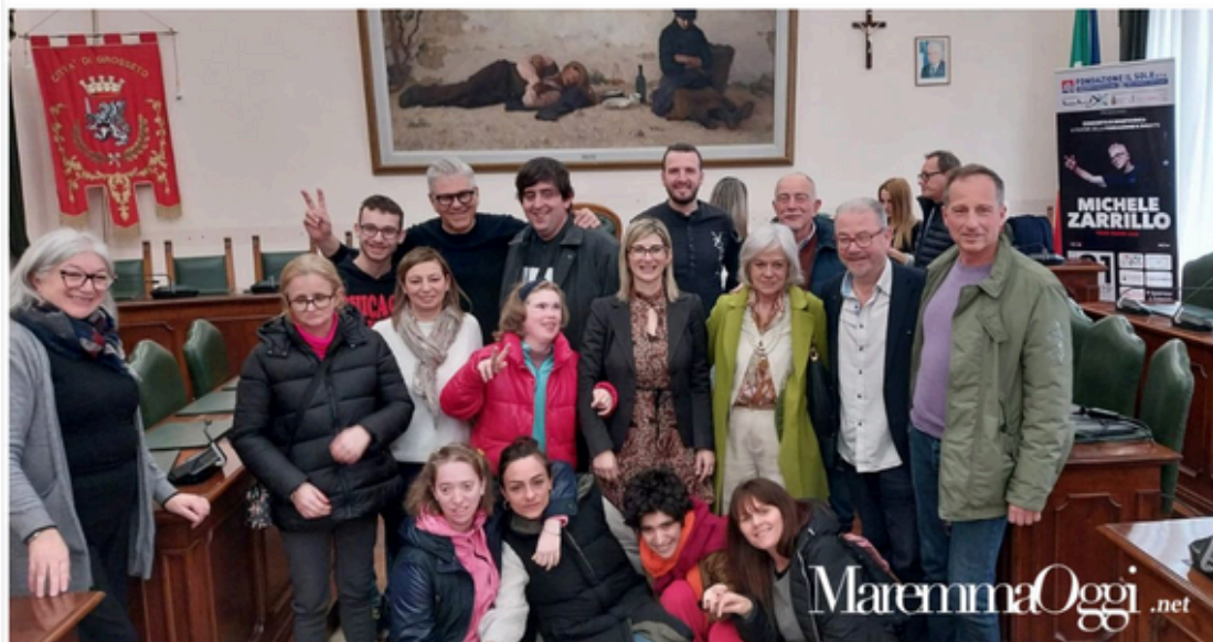
L'evento di presentazione del concerto, Michele Zarrillo con i ragazzi della fondazione Il Sole

GROSSETO. La fondazione Il Sole inaugura la campagna per il 5 per mille con evento eccezionale, sarà Michele Zarrillo il testimonial che si esibirà in concerto al teatro Moderno il 31 maggio alle 21.